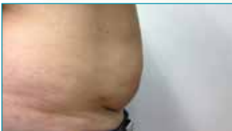
Man 34 jaar: 1 sessie