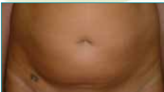
Vrouw 28 jaar: 1 sessie