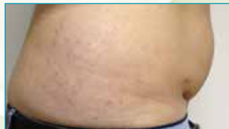
Na 4 weken