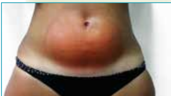
Vrouw 25 jaar: 1 sessie