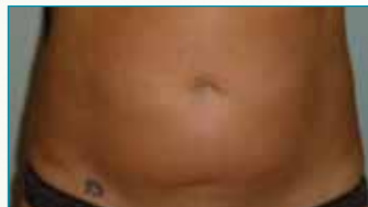
Na 4 weken